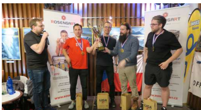
Vítěz ligy firem 2022+2023 firma STRV